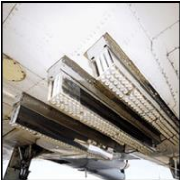
Εικόνα-1: Εκτινασσόμενα φυσίγγια (Ejectable flares) ιωδιούχου αργύρου σε συσκευασία των τουλάχιστον 20 γραμμαρίων σε σύστημα μεταφοράς και πυροδότησης (Belly Racks) αεροπλάνου

Οι διαστάσεις των ήδη χρησιμοποιούμενων φυσιγγίων παρουσιάζονται στο Διάγραμμα-1.